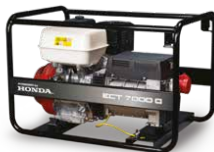
ECT 7000 G