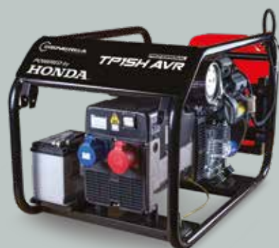
TP 15H AVR